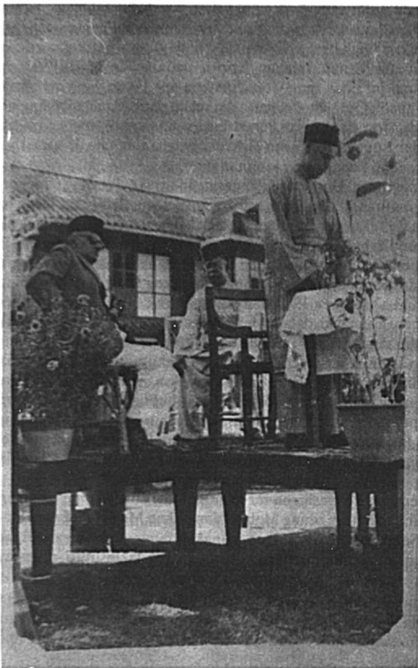
Datuk Onn Jaafar di perhimpunan menentang Malayan Union di padang Sekolah Francis Light, Pulau Pinang, 1946.