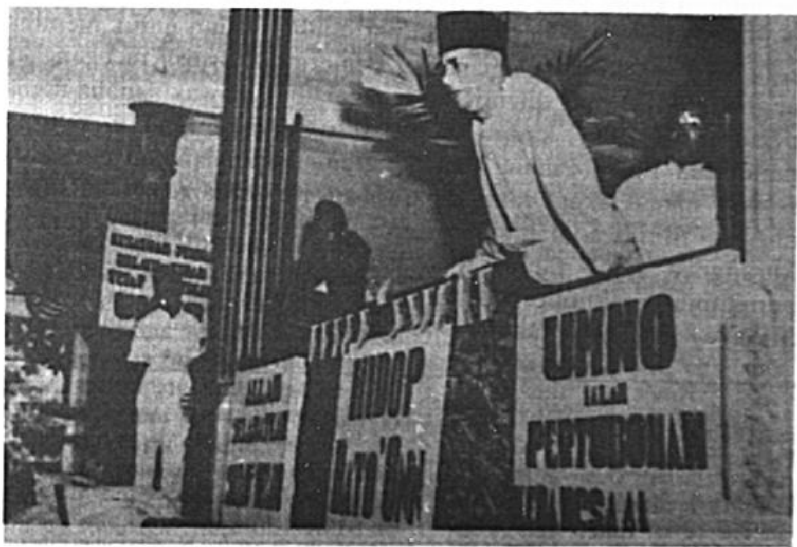
Datuk Onn Jaafar berucap semasa kempen pilihanraya 1955.